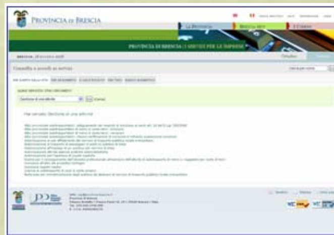
Portale federato dei Servizi