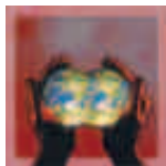
OLTREFRONTIERA Centro Servizi per gli Immigrati