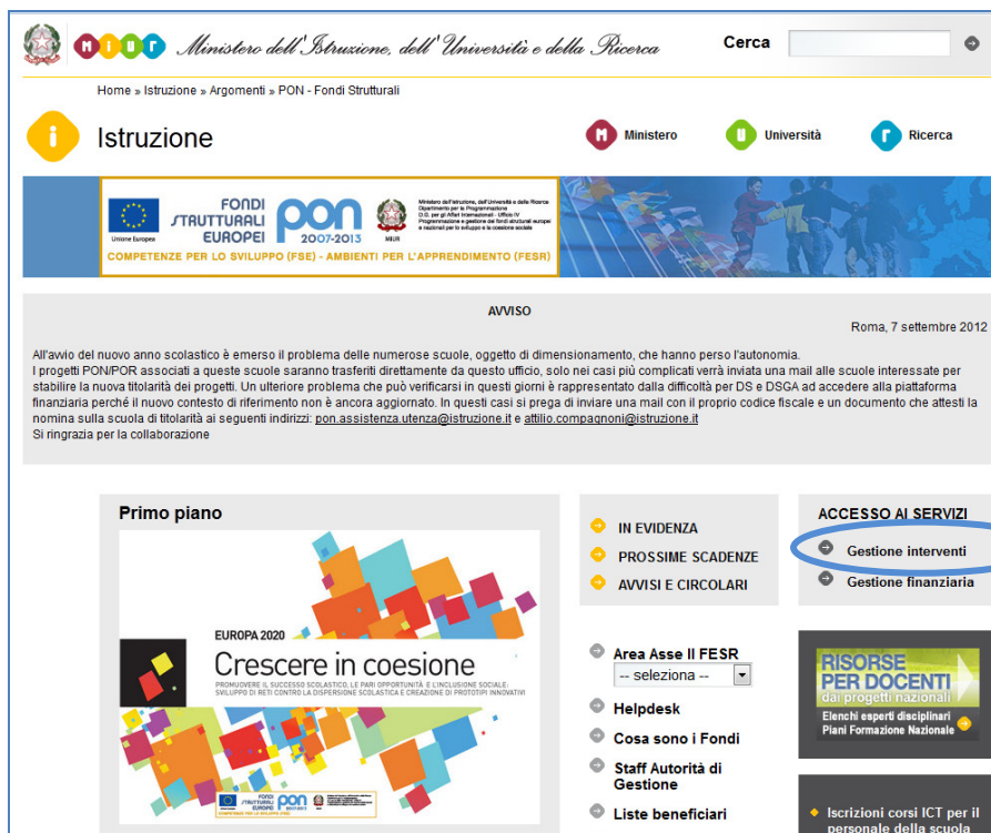
Fig.1 Homepage dei Fondi Strutturali

accede all'area "Bandi e Compilazione dei Piani" (fig. 2);