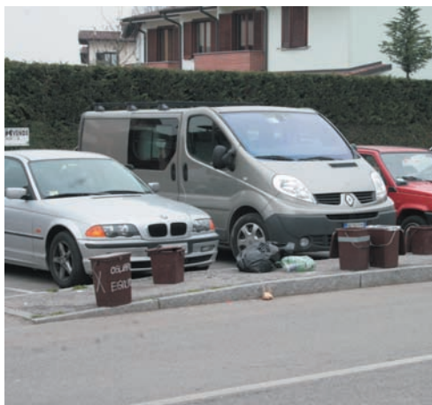
I bidoni dell'umido esposti in via Agnelli