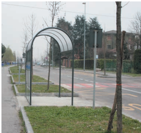
Una delle nuove pensiline per gli autobus

Scusate la schiettezza ma lo spazio è poco. Comunque grazie.