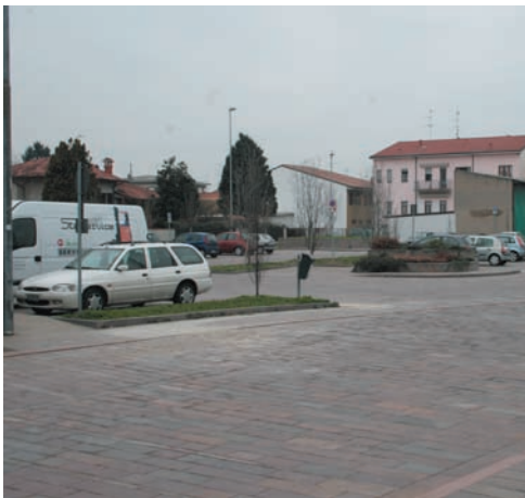
Il parcheggio di via Gramsci

E10) Centro storico pavimentazione marciapiedi via i panettoni rotonda provinciale con accesso via garibal-