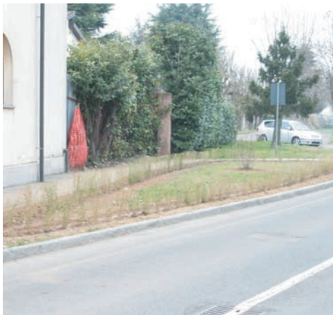
Una delle nuove aiuole di via Agnelli

A23) Vogliamo la pista ciclabile che raggiunga la Bennet, abbiamo raggiun-