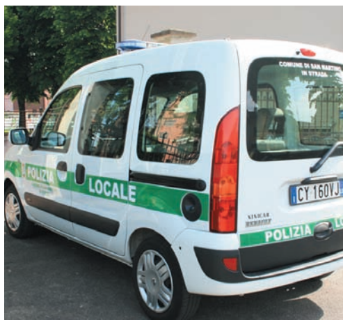
Il mezzo in dotazione alla Polizia Locale

I nostri due agenti sono sempre presenti, anche in momenti straordinari, e sono stati recentemente invitati