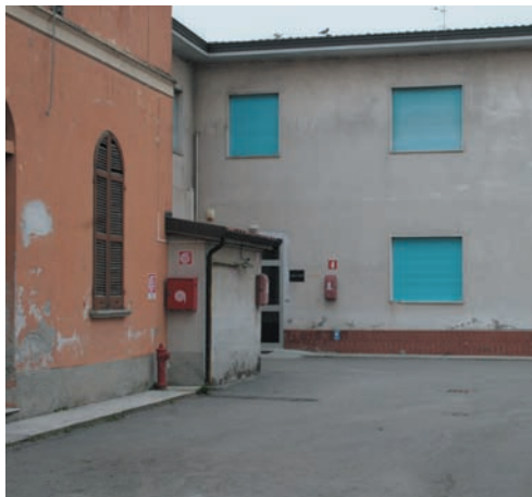
La scuola media di via Ferrante Aporti

Ha proprio ragione, basterebbe un minimo di rispetto in più da parte di tutti.