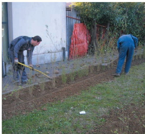
Giardinieri al lavoro sulle nuove aiuole

Data la frequenza con cui alcune questioni sono trattate nei rospi, si è deciso di stendere alcune risposte dettagliate a cui rimandare di volta in volta. Consigliamo una attenta lettura complessiva di queste prima di avventurarsi oltre, così da avere ben chiari gli indirizzi dell'Amministrazione sui temi principali.