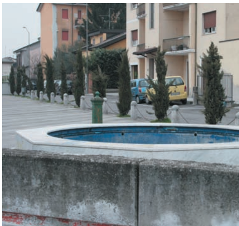
La fontana di piazza del Popolo