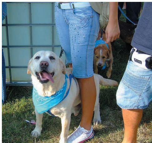
Un'immagine dalla "Festa di Fido"

sono finiti gli spazzini e soprattutto la gente che abita lì e che porta fuori l'immondizia, non ha schifo e un po' di ritegno per chi vorrebbe passare su quel marciapiede!!!..bello avere il giardino tutto curato in casa propria e poi fuori!!! Perché i vigili non passano a segnalare chi combina queste "zozzerie"?... sui bidoncini non ci sono i numeri che corrispondono ai nomi dei relativi proprietari allora se questi bidoncini non vengono ritirati come stabilito dalle norme comunali ci pensino le autorità a punire i trasgressori, perché io sono di San Martino da generazioni e non mi va di dover abitare in una discarica!!! Attraversamento pedonale della strada provinciale 186 all'altezza del ponticello di legno: quante auto si fermano a fare passare i pedoni? Un attraversamento pedonale così pericoloso non l'avevo mai visto oltre ad essere cieco, chi arriva dalle case dei contadini si deve sporgere per vedere se arrivano auto, gli automobilisti arrivano a più non posso e guai se si fermano, anzi se ti sporgi un po' di più ti tirano di quelle strombazzate!!! Ed io che sono mamma di un bimbo piccolo ho sempre rischiato, prima col passeggino ora con la bicicletta e quando mio figlio vorrà andare in paese da solo, con che coraggio gli farò attraversare la strada che ho paura ad attraversarla io?