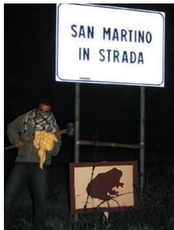
Negri installa un rospo