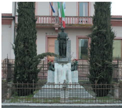
Il monumento ai caduti di via XX settembre

B10) Mi piacerebbe vedere pulito e restaurato il monumento ai caduti. Grazie L.P.