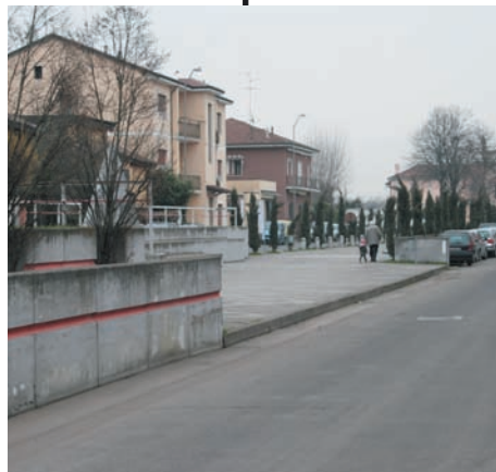
Piazza del Popolo

Ps Sensibilizzare i proprietari dei cani a non lasciare i marciapiedi sporchi grazie