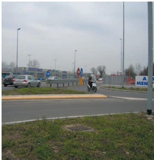
Un motorino entra contromano alla Pergola