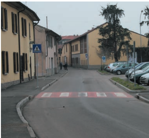
La "nuova" via XX settembre

- la rotonda per la Farmacia subirà molto probabilmente alcune variazioni che, siamo convinti, ne aumenteranno la sicurezza