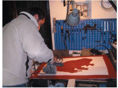
Negri produce un rospo in garage