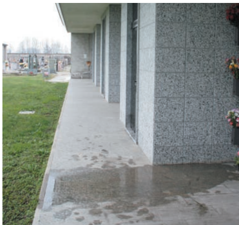
Un'innaffiatura troppo abbondante al cimitero

dell'imminente inverno, e conseguentemente con i primi freddi, l'acqua che cade sul pavimento potrebbe ghiacciarsi e creare una pericolosa patina di ghiaccio che potrebbe far scivolare chiunque si recasse a visitare le tombe.