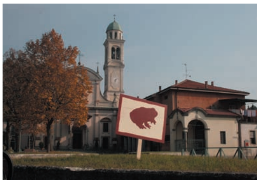
Il rospo invade anche la piazza del Popolo

In sintesi. Il paese in ottobre è stato tappezzato da cartelli di legno, manifesti e volantini recanti la sagoma di un rospo. E' inoltre entrato in azione anche un rospo online, il cui profilo ha catalizzato l'attenzione sul maggiore social network del momento: facebook. Le voci - fuori strada - intanto si moltiplicavano... Svelato l'arcano, l'Amministrazione ha quindi posizionato delle "urne" speciali in tutti i bar e trattorie del paese, e i cittadini hanno potuto "sputare" i propri rospi, scrivendo ciò che volevano attraverso gli appositi fogli. Notevole la risposta dei sanmartinesi, contagiati dalla "rospomania".