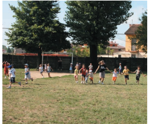
Un'immagine dell'Oratorio durante il CRED

Non è altrettanto pensabile che la sua realizzazione sia compiuta esclusi-