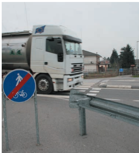
L'attraversamento pedonale della SP 186

Per i rumori vale lo stesso discorso: il Regolamento comunale prevede san- zioni (fino all'ordinanza per toglierlo ai padroni) per coloro che lasciano abba- iare il proprio cane o lo maltrattano e