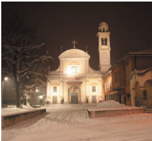
La chiesa parrocchiale innevata

B5) Mi permetto di dirvi che la via XX settembre non va bene, l'ultima parte del senso unico, i due marciapiedi quello di sinistra grande e quello di destra troppo stretto.