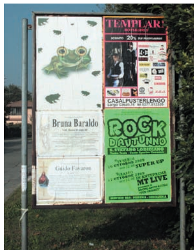
Un'affissione in paese

comparso anche su facebook, il più importante dei social network del momento. Tramite la creazione di un profilo personale abbiamo chiesto l'amicizia ai concittadini per poter stimolare la curiosità e allo stesso tempo avere la percezione di cosa i sanmartinesi pensassero a proposito di questa campagna. • Il giorno 8 (lunedì 2 novembre) la stessa impostazione grafica dei manifesti 100x70 è stata anche riprodotta su 1700 volantini di formato A5 (210 x 148 mm) e distribuita singolarmente casa per casa a tutte le famiglie ed agli insediamenti produttivi del paese.