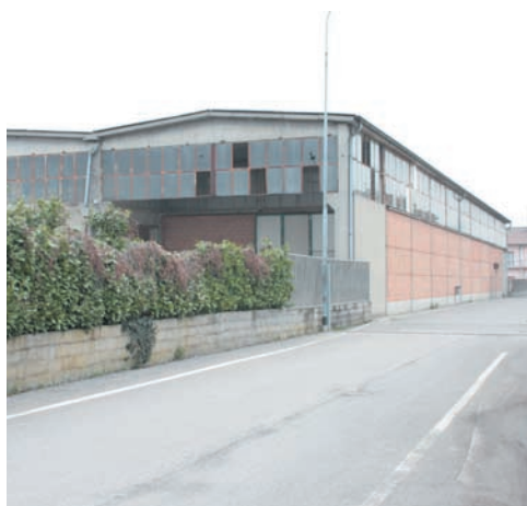
Il capannone della Fark

L'obiettivo dell'Amministrazione Comunale è che sia e togliere l'eternit ovunque sia, dagli edifici pubblici e dalle abitazioni private. La procedura corretta è però di segnalare all'ASL, e per co-