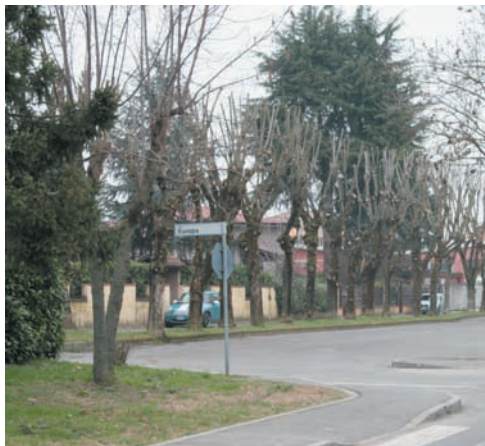
Le potature eseguite in via Agnelli

Molto è stato fatto e sarà ancora fatto per la pulizia delle strade, delle piazze