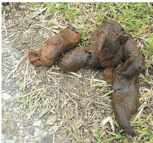
Escrementi di cane accanto ad un marciapiede

Ciò significa che qualora un vigile urba- no, o il sindaco, o qualunque ufficiale di polizia giudiziaria dovesse trovare un proprietario di cane sprovvisto di sac-