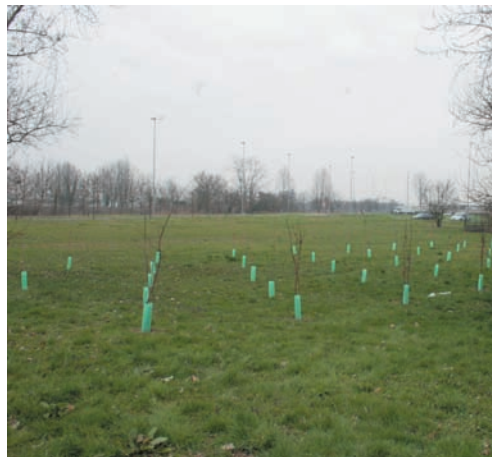
Le nuove piantumazioni

Anche se non sappiamo a che tratto della via si riferisca, cercheremo di garantire un più accurato passaggio settimanale dell'operatore addetto. Già ora comunque, assicuriamo la massima at-