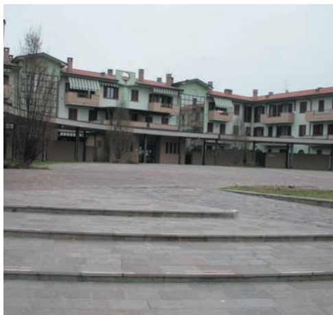
Piazza Pagano vista dal basso

H10) Egr. sig. Sindaco e gente del Comune: è inutile scrivere sempre le solite