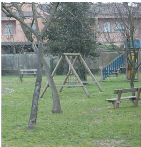
Il parco della Memoria di via Gramsci

le mancanza di rispetto altrui maggior controllo sui ragazzini che incuranti del pericolo giocano sulla strada a pallone non curante delle macchine pur avendo a disposizione parchetti (pieni di escrementi di cani) per i loro giochi.