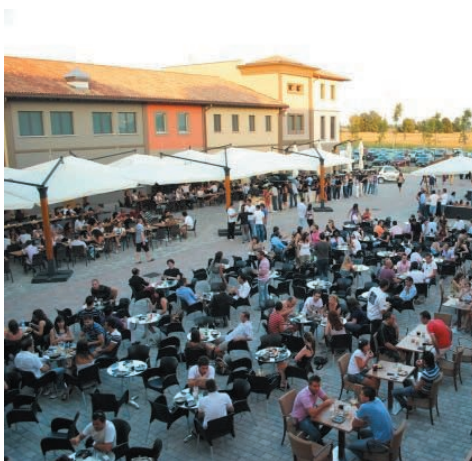
Il cortile interno del Pergola Country Club

A32) Non sopporto il fatto che davanti a casa mia vengano portati i cani di tutta la zona a fare i loro bisogni. Non ci sono cartelli di divieto e nessuno viene mai a controllare o a multare i trasgressori, nonostante sia già stata fatta richiesta al Comune sia da parte nostra che da parte dell'Amministrazione condominiale. Non posso mettermi io a fare il vigile e ad ammonire le persone.