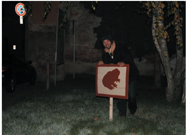
Il Sindaco collabora alla posa dei cartelli in paese