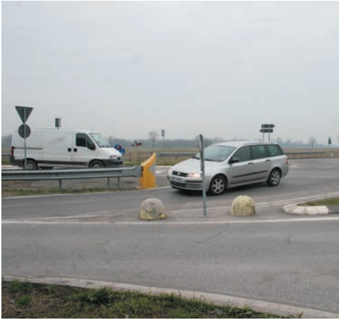
La rotatoria tra la sp107 e via Garibaldi

ho nessuna intenzione di sostituirmi all'operato degli Amministratori ma credo sia necessario una valutazione in merito alla pericolosità di questa strada nei pressi della Rotonda. I veicoli che sulla provinciale provengono da Ossago non so per quale motivo non rispettano lo stop nella posizione in cui è ma tendono a superarlo arrivando quasi in mezzo all'incrocio. Le situazioni che si creano sono due o il veicolo proveniente da Massalengo si ferma in modo veloce, provocando in questo modo un tamponamento con la macchina che segue, o il veicolo sempre proveniente da Massalengo non ha la prontezza di fermarsi e allora si crea un incidente con il veicolo proveniente da Ossago (già si sono verificati parecchi incidenti simili). Figuratevi poi quando la nebbia limita ulteriormente la visibilità. Ringrazio a priori per la disponibilità che il Rospo mi ha fornito che ha anticipato un incontro che già avevo in programma di chiedere al Sig. Sindaco. Vi lascio il mio n. di telefono in caso abbiate la possibilità di ricevermi e approfondire il discorso, n. -----. Un cordiale saluto a tutti P. P.