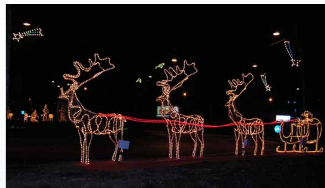
EBOLI, SLITTA CON RENNE LUMINOSA

tante che oggi il Comune sta dando alla cultura, soprattutto perché non solo consente di innalzare il livello artistico-culturale della nostra Città, ma la conservazione e la divulgazione di un patrimonio fotografico, definito dal prof. Giuseppe Fresolone, docente alla facoltà di lettere presso l'Università degli Studi di Salerno "il più grande del Meridione", determinerebbe anche un incremento del turismo ad Eboli».