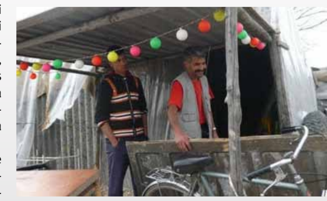
EBOLI, UN ALLOGGIO DI FORTUNA

Rimane, inevitabilmente, il rammarico - umano e politico - per i limiti normativi che impediscono di poter assistere tutti indistintamente, specie considerando la straordinaria ricchezza in termini di apporto economico, culturale e di esperienze di vita rappresentato dai migranti presenti nella Piana del Sele. Esprimo la mia gratitudine a quanti, volontari, laici e religiosi, hanno prestato il loro contributo alla causa dell'emergenza umanitaria di san Nicola Varco.