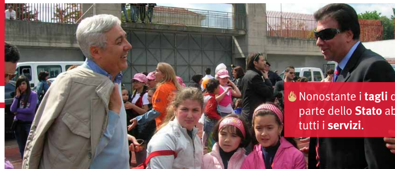
AVV. MARTINO MELCHIONDA Sindaco della Città di Eboli