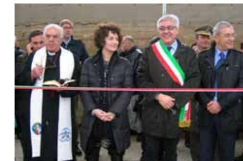
EBOLI, INAUGURAZIONE ISOLA ECOLOGICA

Con tale ristrutturazione all'intera rete fognaria del rione Pescara si realizzerà una separazione tra le acque bianche e le acque nere. L'intervento di ristrutturazione della rete fognaria è inquadrato nelle tante attività con cui l'amministrazione comunale riserva attenzione ai quartieri e alle periferie per la riqualificazione degli stessi e per consentire, in questo caso, di eliminare gli inconvenienti riscontrati da anni nella zona.