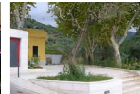
EBOLI, PIAZZETTA ERMICE