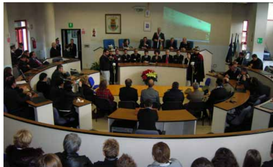
EBOLI, IL PREFETTO, SABATINO MARCHIONE, INTERVIENE IN CONSIGLIO COMUNALE

di Eboli attraverso la costituzione degli ospedali riuniti della Piana del Sele insieme a Battipaglia; aderire all'interporto, adottare ed approvare il PUC; attuare il polo agroalimentare; sollecitare le istituzioni competenti: Regione e Governo Nazionale, affinché assicurino le risorse economiche ed umane necessarie per fronteggiare e risolvere la vicenda degli extracomunitari, sia per ottenere la loro effettiva integrazione, sia per garantire sicurezza e vivibilità ai nostri cittadini. Continuare nei lavori di riqualificazione urbana, non solo del centro cittadino, penso in via prioritaria all'arredo urbano dell'intero tratto della ss 19, da Piazza Mustacchio all'Epitaffio, ma anche delle periferie, in particolare la manutenzione delle strade, dell'illuminazione delle reti idriche e fognarie. Come vedete il lavoro da fare è tanto e sono convinto che anche questa volta gli Ebolitani sapranno scegliere i loro rappresentanti, senza farsi troppo condizionare dalla propaganda elettorale, da critiche ingiuste, magari generate da interessi personali non soddisfatti, perché valuterà le cose realizzate e saprà distinguere il vero dal falso, i fatti concreti dal populismo.