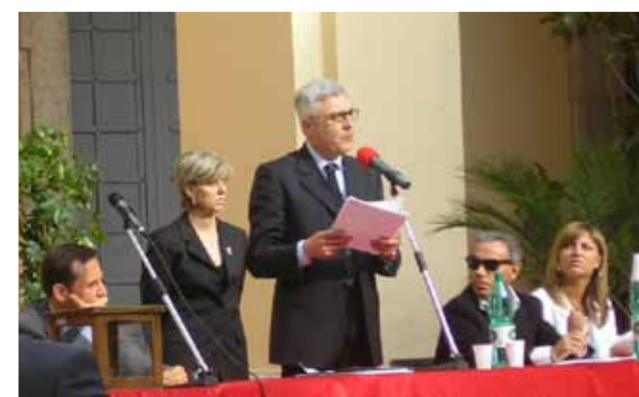
EBOLI, IL SINDACO DURANTE L'INSEDIAMENTO DEL CONSIGLIO COMUNALE