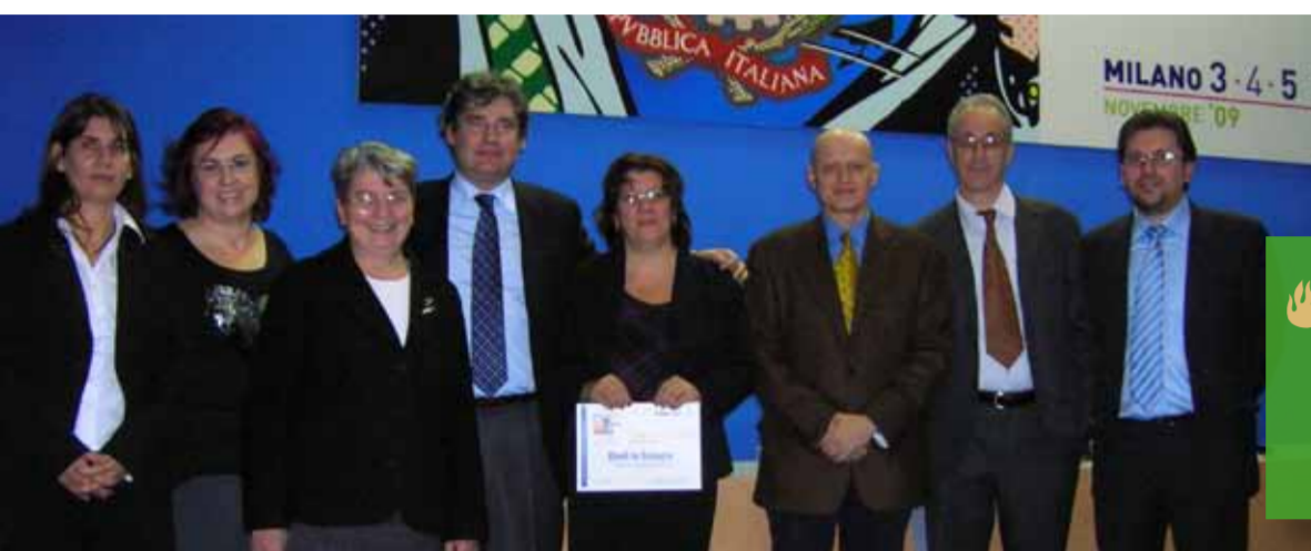
MILANO, LA CERIMONIA DI PREMIAZIONE DI "EBOLI IN COMUNE"

Libri in giro! attraverso la lettura passa il futuro