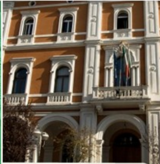
SERVIZI E PROGETTI