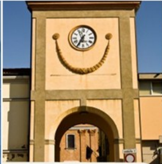
SERVIZI E PROGETTI