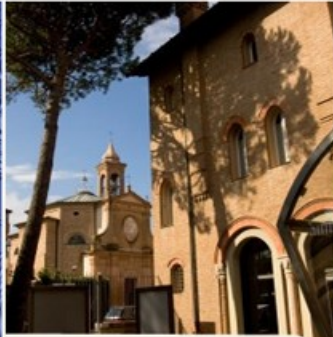
SERVIZI E PROGETTI