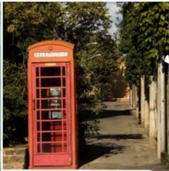
SERVIZI E PROGETTI