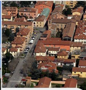
CITTA' E TERRITORIO