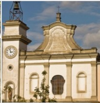
CITTA' E TERRITORIO