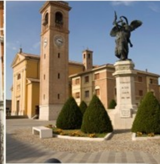
CITTA' E TERRITORIO