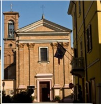
CITTA' E TERRITORIO