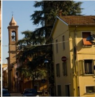
CITTA' E TERRITORIO