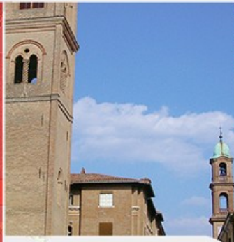
SERVIZI E PROGETTI